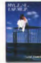
K7 Audio Canada 1999 Polydor / 547 338 4