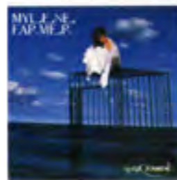
CD Album France 1999 Polydor / 547 338 2