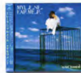
CD Album Japon Polydor / POCF 7397 Contient «L'âme-stram-gram» version Perky Park Pique Dames Club Mix