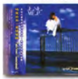
CD Album Taiwan 1999 Polydor / 547 338 2