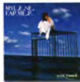
Double 33 tours France 1999 Polydor / 547 338 1