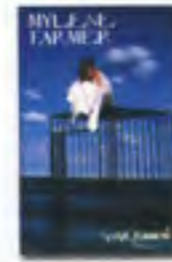
K7 Audio France 1999 Polydor / 547 338 4