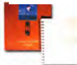
Coffret collector France 1999 Polydor / 547 373 2 3000 exemplaires CD Album présenté dans un carnet à spirales rangé dans une boîte en plastique marron.