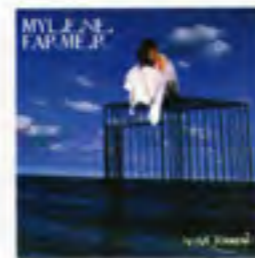
CD Album Canada 1999 Polydor / 547 338 2