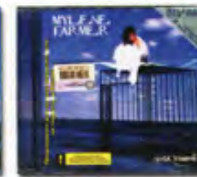
CD Album Russie Polydor / 543 678 2 Contient «L'âme-stram-gram» version Perky Park Pique Dames Club Mix et «Effets secondaires»