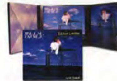
CD Album France 1999 Polydor / 547 338 2 Edition limitée Pochette en carton avec mini PLV