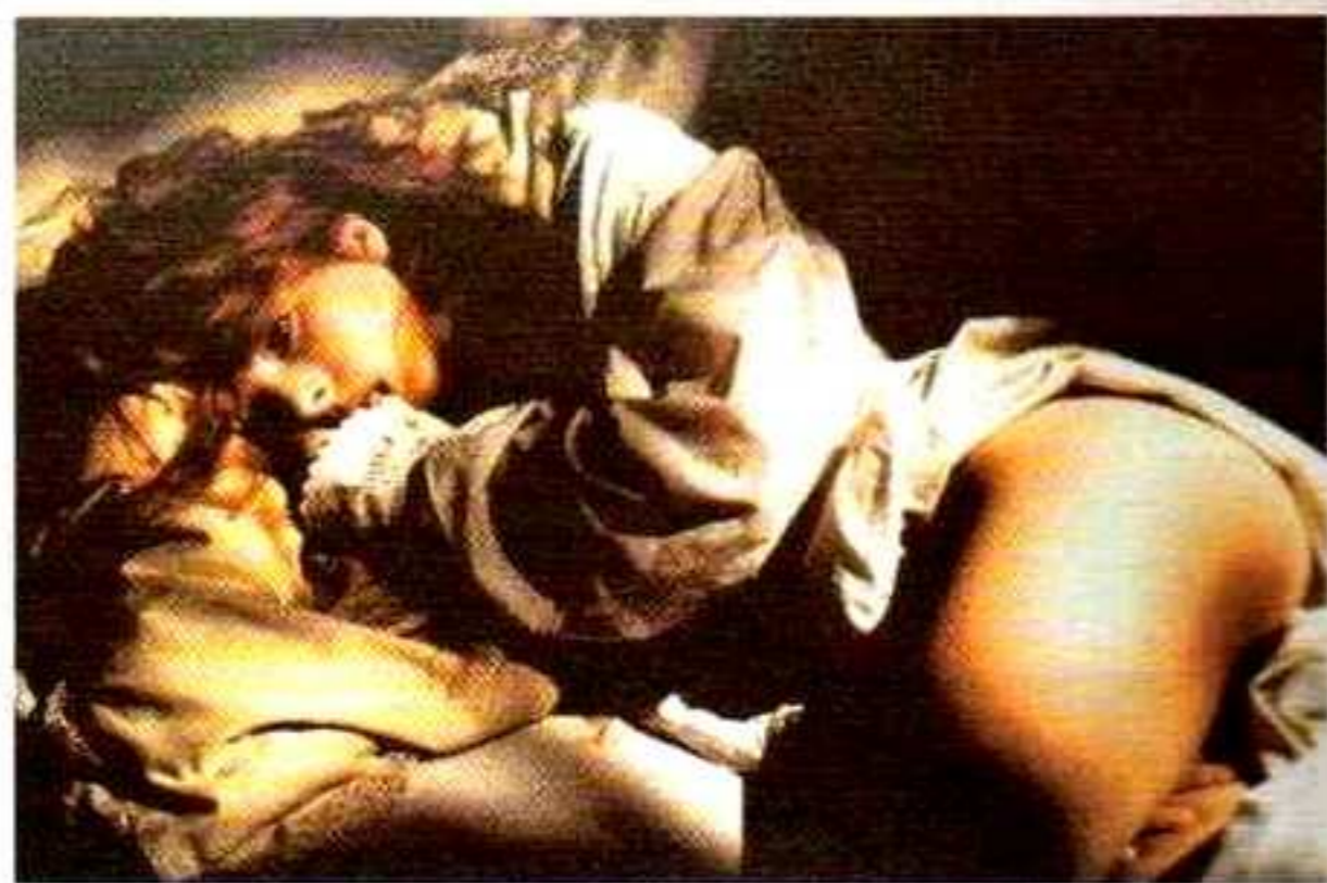
Dans ses clips, Mylène Farmer sait jouer de son côté sulfureux.

Après vingt-cinq ans de carrière, Mylène Farmer, numéro un des ventes de CD en France,